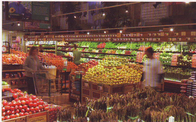
Der „Whole Foods Market“ in den USA ist ein Bio-Eldorado für „Lohas“

Die Wiener PR-Agentur „Newsbroker“ definiert fünf große Lohas-Marktsegmente: nachhaltiges Wirtschaften (sozial verantwortliches Investieren und alternative Transportmittel), alternative Gesundheitsfürsorge (Gesundheits- und Wellnessangebote), ökologischer Lebensstil (umweltfreundliche Geräte, Ökotourismus), persönliche Entfaltung (mind body- und spirit-Produkte) und gesunde Lebensführung (natürliche organische Nahrungsergänzungsmittel). Die 2003 von Petra Steinke gegründete Agentur konzentriert sich mit der in Los An-