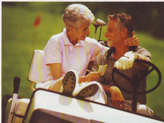
Die weltoffenen Etablierten sind sportlich aktiv und reisen gerne

Innovative Aufsteiger: Die typischen Vertreter dieses Segments sind zwischen 30 und 60 Jahre alt, haben eine sehr gute Bildung, ein gutes bis überdurchschnittliches Einkommen. Häufig sind Führungs- und Spezialistenpositionen hier angesiedelt. Durch die gute Einkommenssituation ist dieses Segment sehr konsumfreudig, teilweise auch als Ersatz für mangelnde Freizeit. Der Konsum wird daher oft demonstrativ ausgelebt. Häufig sind Reisen, speziell Wellness- und Sporturlaube. Der