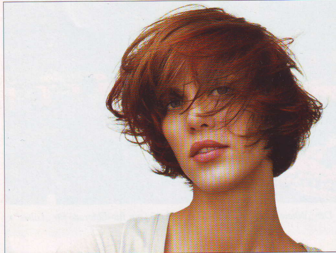
Henkel entwarf eine eigene Haarpflegeserie für „Lohas“

Die Lovos (Lifestyle of Voluntary Simplicity) sehen sich als Alternative zur konsumorientierten Überfluggesellschaft. Diese Gruppe versucht durch Konsumverzicht den Alltagszwängen entgegenzuwirken und stattdessen ein selbstbestimmtes erfülltes Leben zu